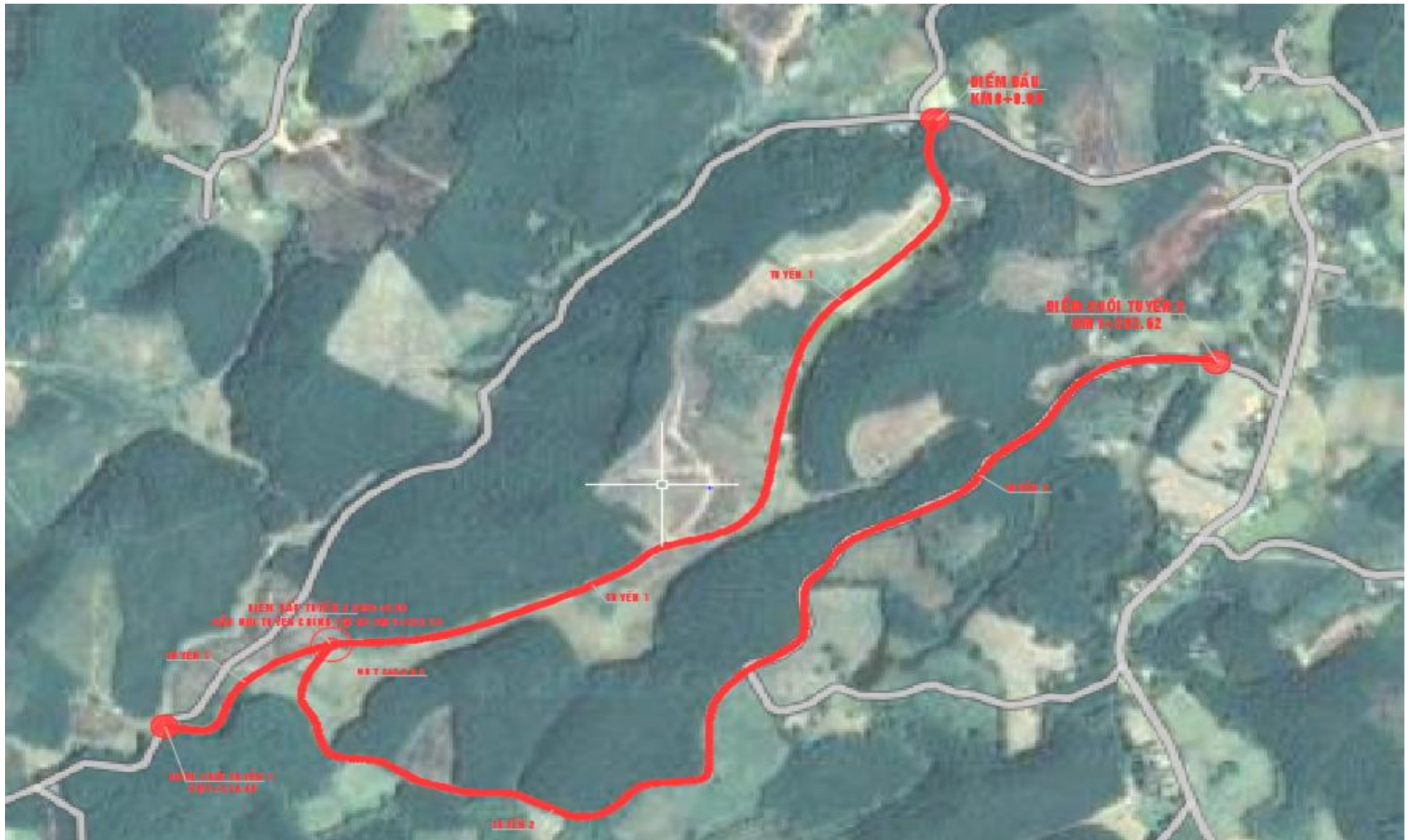
Hình 1.1. Vị trí khu vực thực hiện dự án