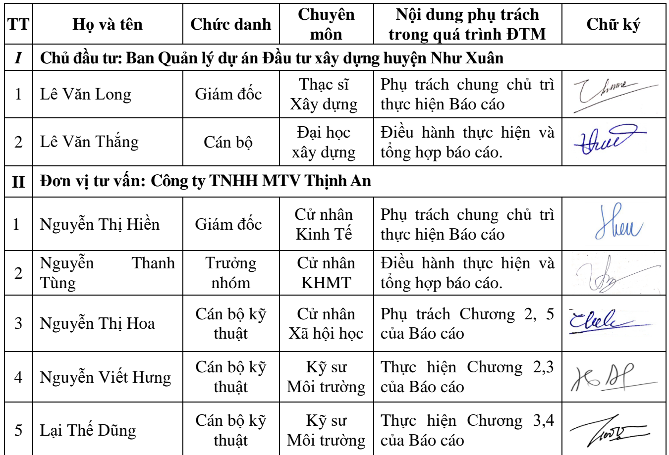
Bảng 0.1: Danh sách các thành viên tham gia lập báo cáo ĐTM của dự án

Danh sách các cán bộ trực tiếp tham gia lập báo cáo ĐTM được thể hiện trong bảng sau: